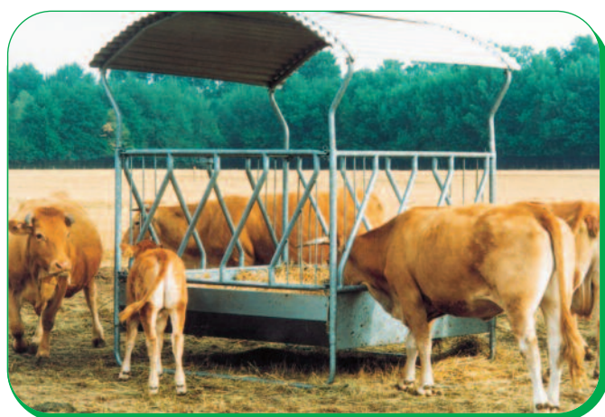
RÂTELIER 4 FACES OBLIQUE

TOUS NOS PRODUITS SONT GALVANISÉS À CHAUD APRÈS FABRICATION