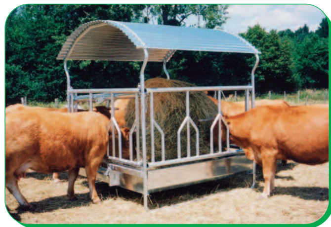
RÂTELIER 4 FACES FESTONS