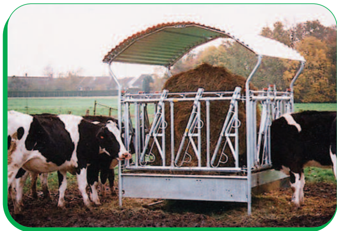
RÂTELIER 4 FACES SAFETY

- RÂTELIER 4 FACES OBLIQUE : pour animaux de toutes tailles, même encornés.